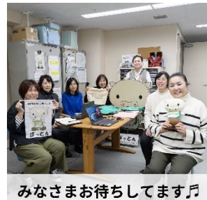
みなさまお待ちしております♪

川崎市内の福祉人材確保を図るため、福祉分野(主に介護)に関心のあるハローワーク求職者と川崎市内の施設事業者との小規模の説明会・相談会(グループ座談会)を6回開催します。